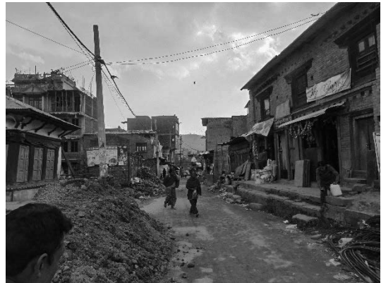
写真10 被害を受けた集落の状況