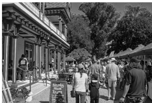
写真 20 “Famer’s Festival” の賑わい

震災直後には一時的に開催は見送られていたが、また再開されるようになって人気を高めていて、多くの市民が参加するようになっている。