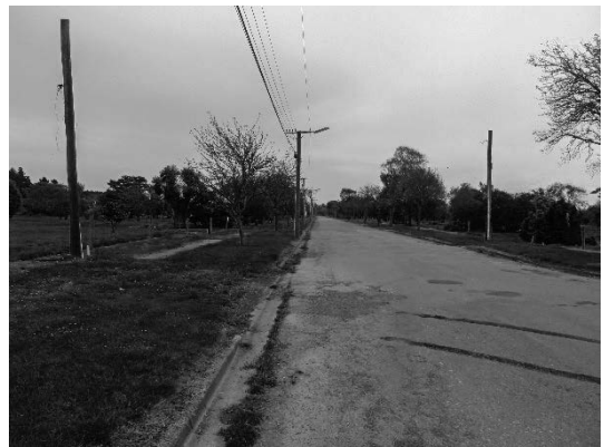
写真18 住宅建設が禁止された地区の状況