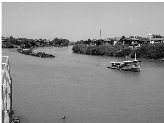
写真 23 チャオプラヤ川の風景