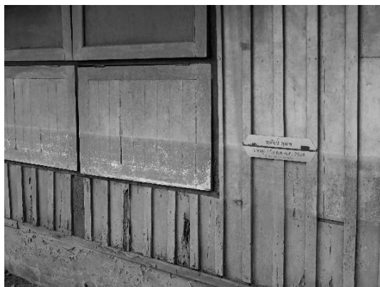
写真 22 壁に記録された洪水の跡