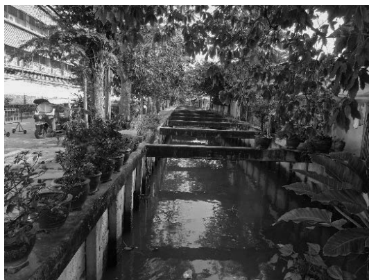
写真 30 バンコク市内を流れる水路