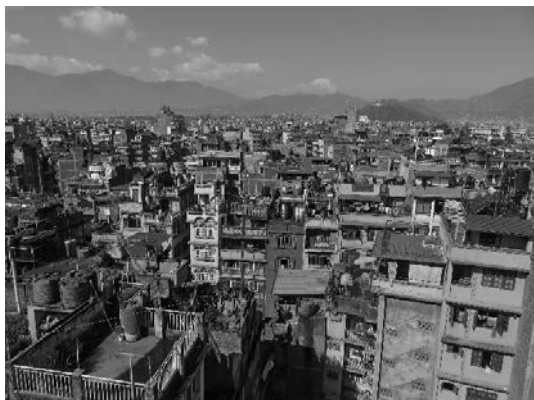
写真1 カトマンズの都市環境

丁度この年の翌年、2015年4月にカトマンズの北西約80kmのゴルカ地域でMw 7.8の巨大地震が発生