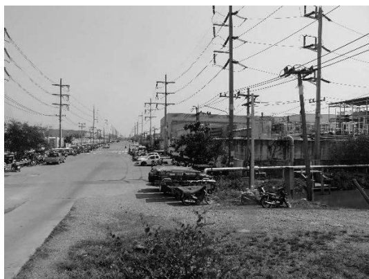
写真 26 広大な工業団地を囲む堤防