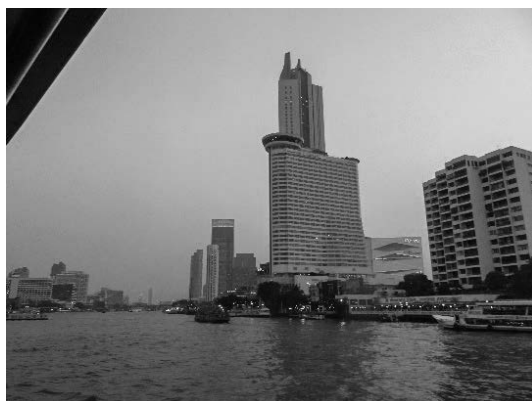
写真 32 河口のウォーターフロント

には、タイ工業省により各工業団地に対して具体的な洪水対策が進められた。詳細はタイ工業省の Web site で公表されている。