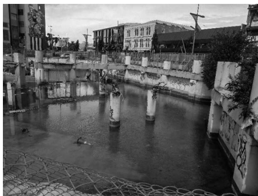
写真 14 被災した建物の遺構

多数の死傷者が発生させた。クライストチャーチ国際空港も管制塔が崩れるなどの被害を受け一時閉鎖された。