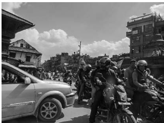
写真4 カトマンズ市内の交通状況

生し、その17日後にはカトマンズを挟んで反対側のカトマンズの北東で再びMw 7.3の大地震が発生した。