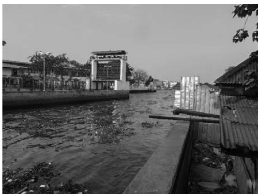
写真 31 チャオプラヤ川に設置された水門