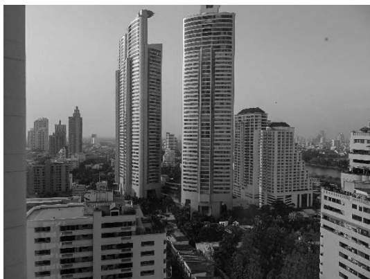
写真 21 バンコクの景観