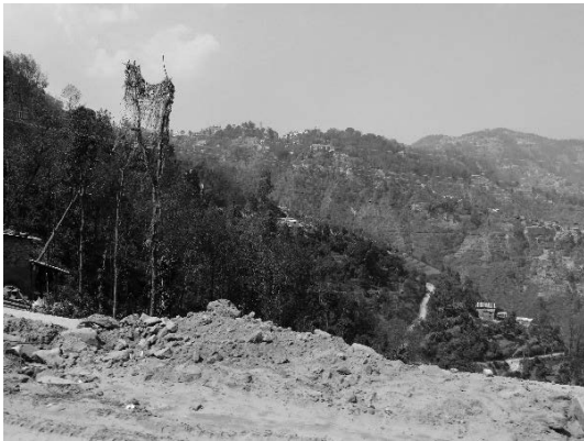
写真9 山岳地帯の道路と集落の状況