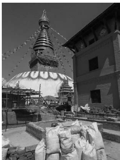
写真3 被災した寺院