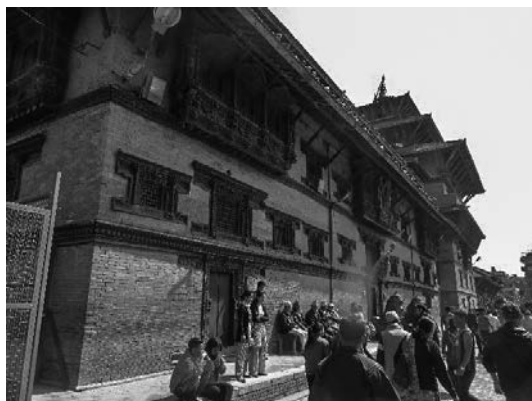
写真6 被災した建造物に集う観光客