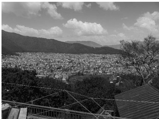
写真2 カトマンズ盆地を埋める建物群