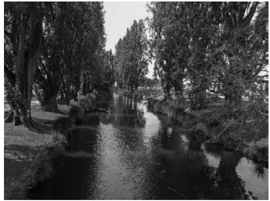
写真16 市内の公園を流れるエイボン川のせせらぎ

多く、近代的な市街地に変貌しつつあった。クライストチャーチ大聖堂も被災した状況で保存されており、近くには仮設の大聖堂が建てられていた。