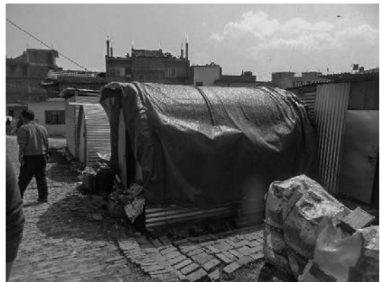
写真12 被災地に建てられた仮設住宅

かあり通過するのに時間を要した。カトマンズ盆地を北東方向に抜けると、広大で急峻な山岳地域となり、深い溪谷を流れる川に沿って、曲がりくねった道路を進むこととなった。途中の集落では、建物の被害も散見されるようになったが、急峻な斜面の崩壊も多く発生した形跡が多く認められた。山岳地域は集落もまばらで人口も少なく、被害分布の全容については、把握することは極めて難しいと思われた。