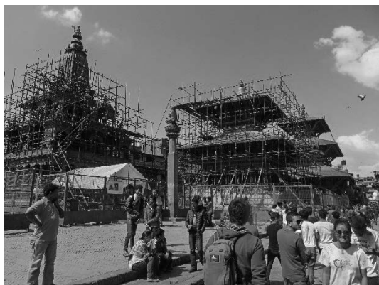
写真5 被災した歴史的建造物