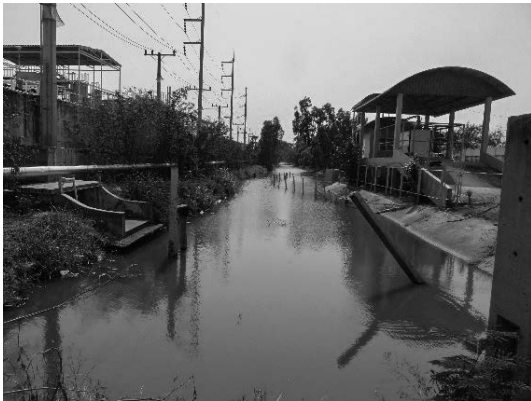
写真 27 排水路と排水ポンプ