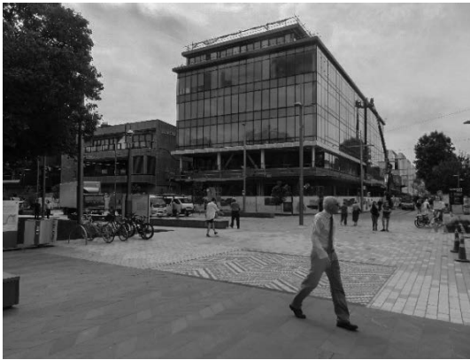
写真15 中心市街地“シティー”の復旧・復興状況

震源がクライストチャーチの真下に伏在した未知の断層であり、大きな揺れと大規模な液状化現象が発生した。そのため、被害発生地域は中心市街地の“シティー”と呼ばれる中心市街地に限らず広域に及んだ。郊外に広がる沖積低地においても大規模な液状化が発生し、地震発生当初には“世界最大の液状化現象”として報道され、被害の大きな要因ともなった。その後、日本で発生した2011年東日本大震災における関東北部の利根川流域から茨城県霞ヶ浦周辺の北関東から千葉県浦安市や首都圏の広範な地域に液状化現象が発生し“世界最大の液状化現象”は、この日本での液状化に移ったが、クライストチャーチでの液状化も広大な地域に及んだ。元々市の中心地域で、クライストチャーチ大聖堂を中心とした市街地は、多くの市民や観光客が集う市街地であり、ここでも液状化による被害が多く認められるが、非常に強い横揺れの地震動で多くの建物が被災した。この地域では現在再開発が進められ、新しくモダンな低層の鉄骨建物が数多く建設されている。建物は免震構造や耐震的に補強された軽量の建物が