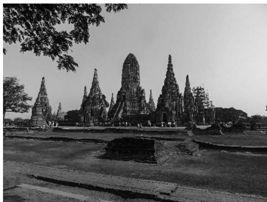
写真 24 アユタヤの歴史遺産