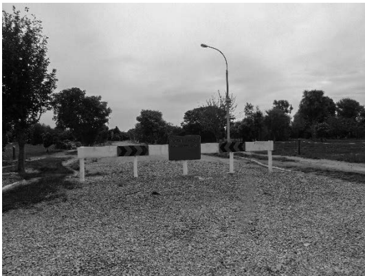
写真17 立ち入り禁止となった住宅地域

この中心市街地“シティー”からエイボン川の流域に沿って海岸地域に至る住宅地でも広大な地域で液状化が発生して住宅の被害が広がり、生活が不可能な状況となり、どのように復旧・復興が進められる予定なのかは不明であるが、現在完全な立退きが法的に定められているようで、更地状態にあり周囲