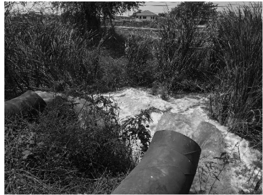
写真 28 排水ポンプによる排水状況