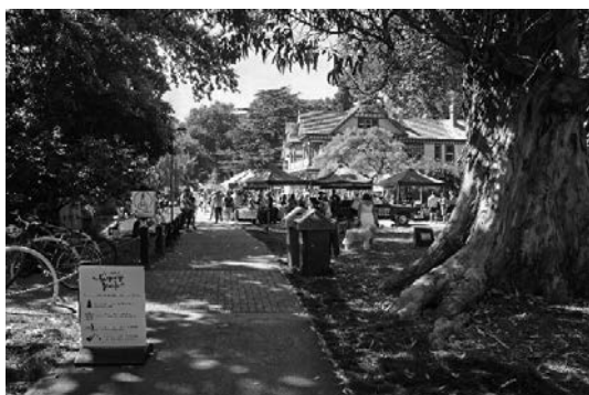
写真 19 “Famer’s Festival” の開催風景

滞在中の週末には、郊外の公園で毎週開催されているというバザー“Famer’s Festival”を訪れた。近郊の農家の住民が、各自の農園で収穫した野菜や乳製品、それを加工した産物を持ち寄って、販売しながら交流を行うイベントで、野外コンサートなども開催されていた。