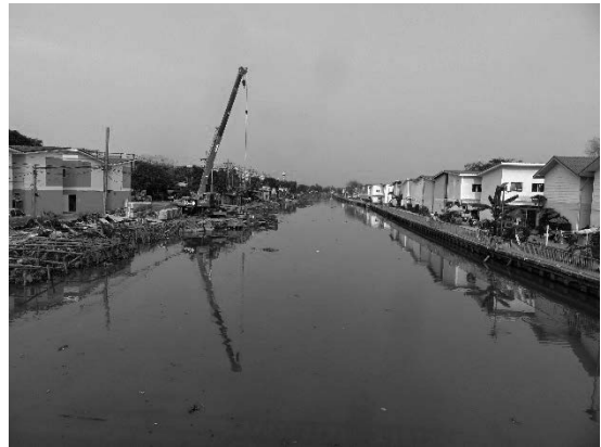
写真 34 再開発された川沿いスラム街