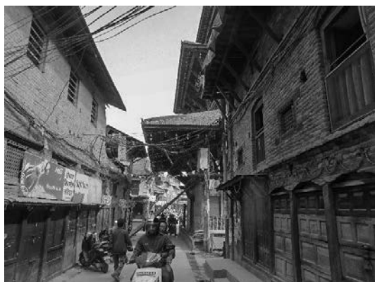
写真8 被災地域の市街地と道路の状況

かった。しかし、東側の震源地に近いバラビセ地区については道路が確保できていたため、近づける麓の街までは何とか車で行くことができた。