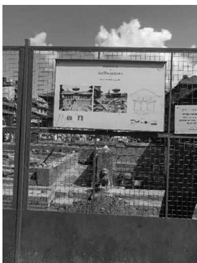
写真7 歴史的建造物の修復工事