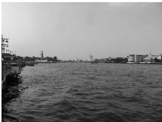
写真 29 チャオプラヤ川の河口付近