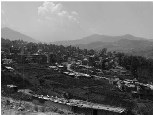
写真11 カトマンズ梗概の市街地