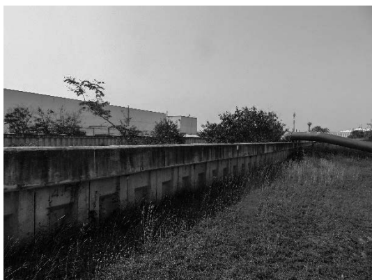
写真 25 工業団地の堤防と排水ポンプ