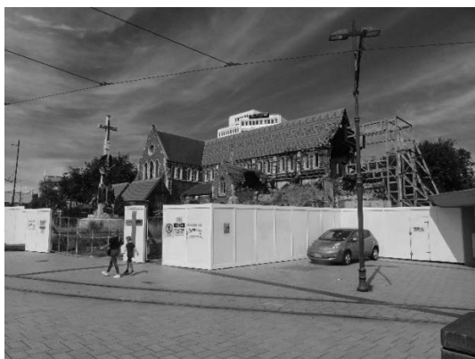
写真 13 被災した大聖堂の建物

特に、クライストチャーチでは観測史上最大規模の液状化現象が発生し、カンタベリー大学の調査によれば被害家屋は 40,000~50,000 棟に上るとされている。特に、市内の中層ビル 2 棟が倒壊したことで