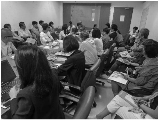
写真 33 CODI での再開発計画の説明会