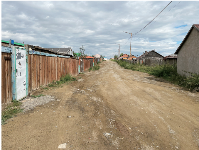
図4 バヤンゴル区西端ゲル地区街路

ウランバートルの中央を東西に横切る幹線道路があり、中心部から西ではその道路の北側に住宅開発エリアが連なっている。その住宅開発エリアの北側に、広大なゲル地区が広がっており、この節で紹介するゲル地区は、中心部から西へ10 kmほど行ったあたりの、Tolgoit 鉄道駅の北西に位置する。