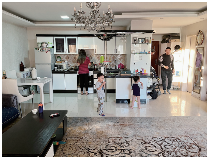
図 30 居間的な領域（右が玄関）

共有部分を通して玄関を入ると、入って右手に倉庫のようなスペース、左手にバス・トイレの扉があり、その向こうに広い居間的な領域がある。この大きな部屋は西側に大きな開口部が二つあり、その反対側の壁沿いにキッチンがある。部屋の南側の壁の向こうには、バス・トイレと並んで夫婦の寝室がある。