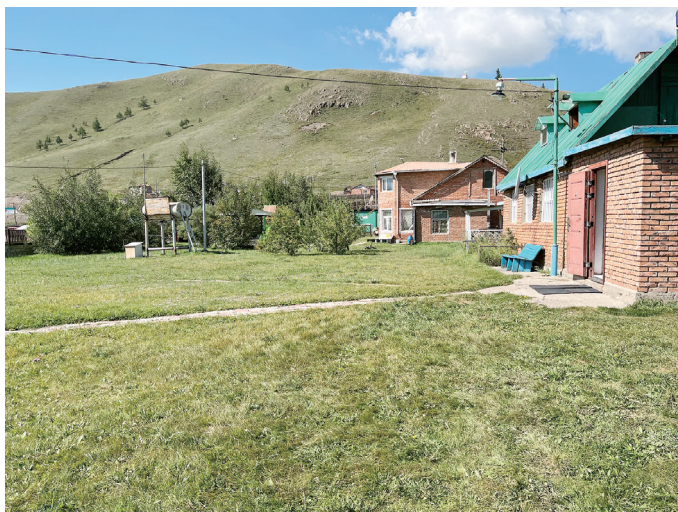
図 17 バイシンとベンチ（右）と給水タンクと犬小屋（左）

東南に面に街路をもつ角地で、フェンス沿いには綺麗に整えられた木々が並び、芝生で覆われた敷地内も綺麗に整備されている。敷地中央に脚のついた給水タンクや犬小屋があり、その東側が家主の敷地だそうだが、柵などで区画されてはいない。敷地の北寄りに、レンガ造のバイシンが建っている。南側の街路の中央付近に青く塗られた入口扉があり、そこからバイシンの玄関までまっすぐ自然石を敷き並べた通路がある。玄関からはもう一本、南東の角にあるトイレに向かって舗石ブロックの通路がある。東側の街路には車の出入り用だと思われる幅の広い扉があり、そこから入ると、すぐ右手（北東角）に元ガレージだったと思われる木造平屋の建物がある。内部は広く、草刈り機などの庭仕事の道具と、冷蔵庫やベッドなどの生活用具が混在していて、コンクリートのたたきにはカーペットが敷かれていた。訪問時には親戚だという小学生二人の生活空間となっていた。