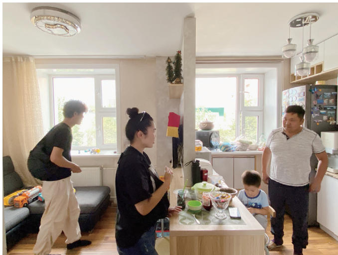
図 26 半分ほど解体された壁に造り付けられたダイニングテーブル（右がキッチン）

同地区内の別の建物の4階にある住居である。夫婦と2人の子どもの4人暮らしである。玄関までのつくりは「あん摩師の施術場の住居」と共通している。玄関を入ると靴脱ぎの場に続いて廊下があるところも同様である。廊下に面して、右手（南側）にキッチン・ダイニングとリビング、左手（北側）に比較的大きな個室が二室並ぶ。廊下の突き当たり、リビングと北東側の個室の間にバス・トイレがある。基本的な構成の考え方は「あん摩師の施術場の住居」と同じである。