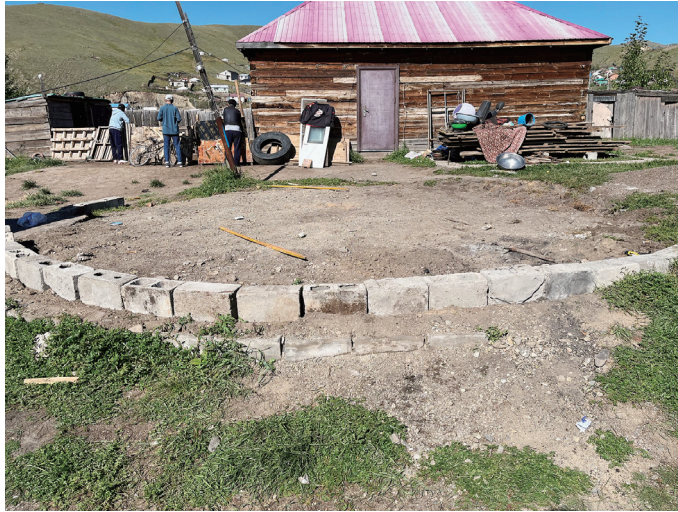
図 22 円形に並べられたコンクリートブロック（後ろは建設中のバイシン）

奥にあるバイシンの他に、入口付近にゲルが一棟建っていた。このゲルを使って生活をしている様子はなく、床も土のまま倉庫として使用しているようだった。視察時には、新たに一棟ゲルを組み立てようとしていた。壁の構造になる木製の蛇腹の部材が劣化したため新調したので、それと元々使用されていた屋根を構成する木製の部材の噛み合わせを試しているところだということだった。バイシンと既存のゲルの間に建設予定地があり、コンクリートブロックが円形に並べられていた。その横には、フェルト製の天幕が移動用に畳まれたかたちで台に積まれて置かれていた。