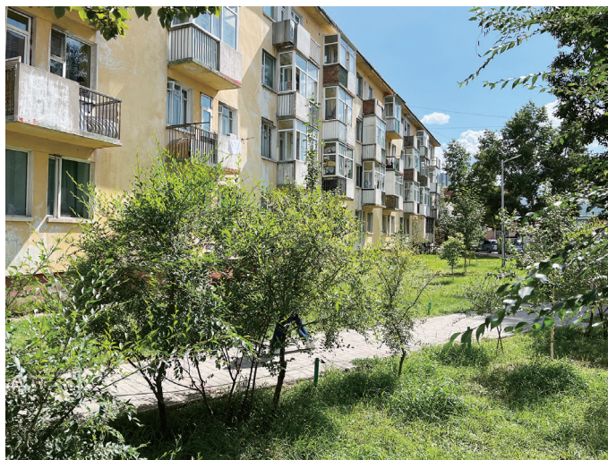
図24 集合住宅と中庭的な部分

スフバートル広場から南に2 kmほどのところに、社会主義時代にできた集合住宅団地がある。スフバートル広場の西側を南北に結ぶチングス通りを南に下り、平和橋を越えて少し南西に行ったあたりである。近くには大きなショッピングモールやスポーツ施設があり、高層建物が建ち並ぶ。団地内には4、5層の板状の建物が、適度な距離を保ちながら整然と建ち並び、建物間を舗装された道路や敷石がきれいに並べられた路地が繋ぐ。建物前に植えられた木々の緑に加え、建物に囲まれた中庭的なところには樹木や遊具、休憩所、ベンチなどを備えた公園が設けられている。この集合住宅団地は1966年に竣工しそうだ。1965年に発生した百年に一度といわれる大洪水の被害を受けたゲル地区の住民たちが、数多く移住してきたということである。