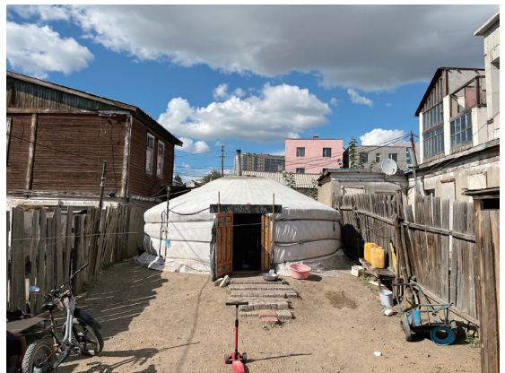
図14 パイシン住居（左）とゲル住居（右）

前述した1900年代初頭の様子を描くウルガの絵図には、この門前町の様子が描かれている。その中でも、木柵に囲まれゲルが並ぶ僧侶の住居地区が寺を取り囲んでいる。現在の木柵の向こうにゲルやパイシンが並ぶ様子は、既に触れてきた近代以降に生まれたゲル地区と変わらない。この門前町ではゲルやパイシンの内部での生活の様子を確認することはできなかったが、生活空間、居住環境、集落の構成法などに共通するところが多く見られる。ウランバートルにおける定住のかたちの原型の一つであろう。