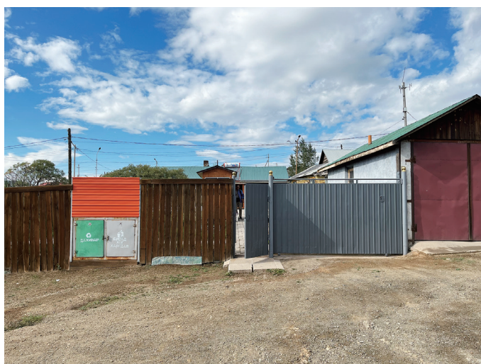
図7 シャワー小屋のあるバイシン住居正面（左がゴミ置き場の扉）

本地区では、ゲルが無くバイシンだけで構成される住居も多くみられた。この住居のある街路は特に綺麗に整えられている印象があった。区画の南北両面がゆとりのある街路に接している。各区画には出入口などの他に、高さ1m程度の緑色に塗られた扉と灰色に塗られた扉が2つセットで設けられている。ゴミ置場の扉である。その扉の内側にあるゴミ置場にゴミを置いておけば、ゴミ収集車が定期的に回収に来るといふ。