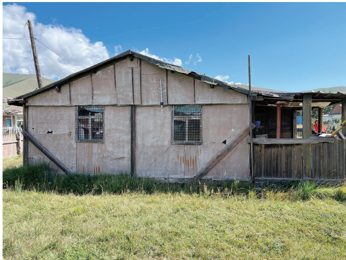
図19 1980年代からあるバイシン

「二階のあるバイシン住居」の北東100mくらいのところに、1980年代から暮らす家族の家がある。やや東西に長い区画で、西側の街路に旗竿状に接している。区画内部は、あまり丁寧に手入れがされている感じでは無いが、草原のように緑で覆われており、低い木柵で囲まれている。訪問時には、干すためか、布団などが緑の上に点在していた。中央付近の北寄りに浅い切妻屋根の木造のバイシンが建っている。南側に間口いっぱいの下屋があり、東側1/3ほどが倉庫、西側2/3ほどが玄関前にあるテラス的な軒下空間である。全体に建てられた当時のままの様子が残されているようだ。外壁はセメント板のようなもので、内部に断熱材があった。これらは後になってからの改修だろう。