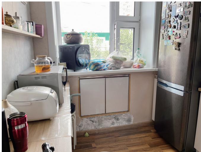
図 27 キッチン（窓の下部には食物保存用の棚）

北側の個室は、それぞれ子ども用の寝室と夫婦の寝室である。子ども用の寝室の外側にはサンルームのようなバルコニーが設けられている。全面的に改修されているが、開口部の取り付け以外は、全て自分たちで作業をしたようだ。セルフビルドとは思えない、完成度の高さであった。構造としてはレンガ造で、厚さ 60 cm ほどの外壁に PC 版の床を渡している。改修においても、こうした架構に配慮して壁の解体部分の検討がされていた。また、キッチンの窓の下部には、冷たい外気温を生かした食物保存用の棚が壁に埋め込まれていた。この収納棚は「あん摩師の施術場の住居」にも同様のものがあつた。建設当初からあるものなのか、改修時に設けられたものなのかはわからない。確認はしていないが、ゲルにおいても同様の外気温を生かす工夫があるのかもしれない。