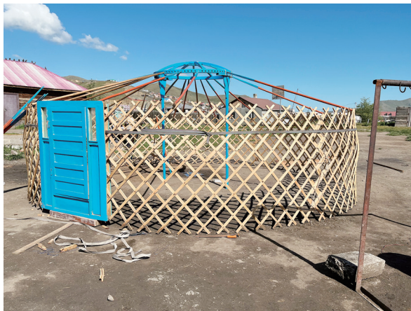
図 21 建設中のゲル

この区画はかなり広がったが、実際にどこまでが彼らの所有地なのかは判別できなかった。南北に長い土地で、東側の南半分が接道していて、区画への入口がある。傾きかけている木柵で囲まれた区画内に入ると、正面にバイシンがあり、北の方にももう一棟のバイシンが建っていて、その奥にはゲルもある。親戚の家だというそれらの建物は家主不在であった。自分たちで建てているという彼らのバイシン住居は、角材が積まれた校倉造りの平屋で、東面に扉が、南面に樹脂サッシの窓が二つはめ込まれていた。躯体はほぼ出来上がっているようだが、内部は作業中のようなようだった。