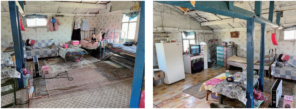
図 20 室内東側部分（左）と室内西側部分（右）

4面全ての面に開口部が設けられているのも、このバイシンの特徴である。他のバイシン住居でみられるような南への方向性は感じられない。また、玄関やキッチンは領域化されておらず、正方形に近い四角い一室空間である。壁は4面とも同じ花柄の壁紙で仕上げられている。壁面に沿って家財道具や家具が並ぶ様子などからも、空間的にはゲル住居に近い。一方、中央にあるのはテーブルのみである。家財道具や家具との関係から時間毎に異なる領域を生み出すというのはゲル住居と同様だと思われるが、中央のテーブルと連動しながら生まれる活動は多くないだろう。調理道具もストーブとは別に用意されている（両方に鍋が載せられていた）。ゲルのような強い中心性を感じることは無く、一室空間内に均等に種々の活動の場が点在しているように感じられた。