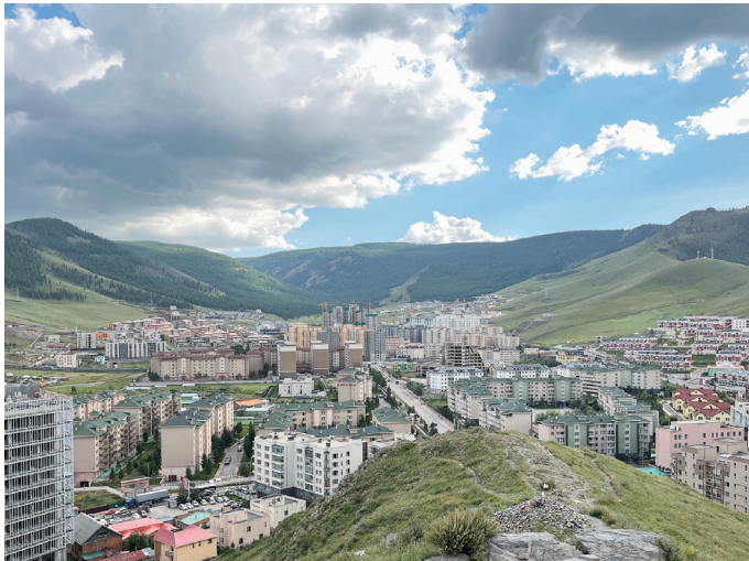
図3 ザイサンの丘南側開発地域

中心部から南に向かいトーラ川を越えたあたりはハンオール区の北東端部にあたるが、そこにザイサンの丘と呼ばれる小高い山がある。その周辺では近年開発が進んでおり、富裕層向けの住宅、高級商業施設、インターナショナルスクールなどの施設が建設されている。トーラ川にかかる橋の渋滞などから中心部への交通の便は悪く、地勢的に開発可能なエリアも限られる。そのため、限られた層向けの開発に絞られているのかも知れない。