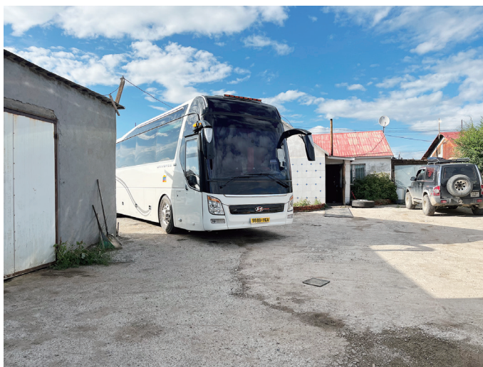
図 11 大型バスのあるバイシン住居（バスの後ろがバイシン）

このバイシンは「シャワー小屋のあるバイシン住居」と同じ街路に面し、300 mほど西にある。夫妻と2人の子どもの4人が暮らす。ご主人は車好きでかつては敷地内で修理工場を営んでいたが、現在は大型バスを2台所有し、その運用で生計をたてているという。敷地内は全面がコンクリートで舗装され、バイシンのほかにガレージとして使用していた大型の倉庫がある。大型バスが一台、敷地内に停まっていたが、さらにもう一台のバスも入れられるほどの大きさの敷地である。婦人はこの地区の幼稚園に勤務しており、30代半ばの共稼ぎ世帯である。