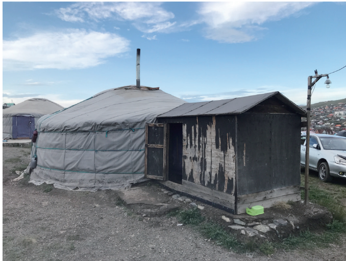
図5 丘の上のゲル住居

だった。ゲル以外には敷地の端にトイレと倉庫があるだけで、バイシンは併設されていない。ゲルには、初老のご夫妻と若夫妻、まだ小さい子どもの5名が生活していた。