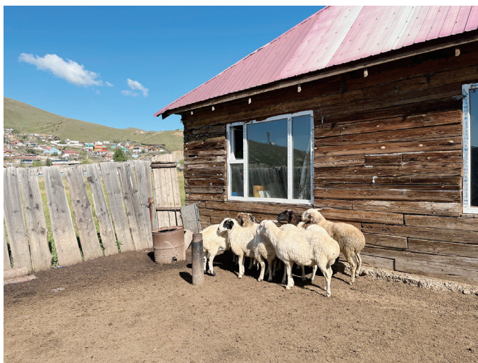
図 23 敷地内で飼われている羊（右は建設中のバイシン）

バイシンの南側を合板や木のパレットで仕切って6頭ほどの羊を飼っていた。南西の角には羊用の小屋もあった。羊の飼育場では羊の糞をそのままにし、羊が歩き回ることによって糞を踏み固めさせ、冬期にはそれを切り出し燃料として使用しているということだった。これらの羊は個人に販売しており、数ヶ月ごとに草原で遊牧をしている親類より取り寄せて補充しているということである。