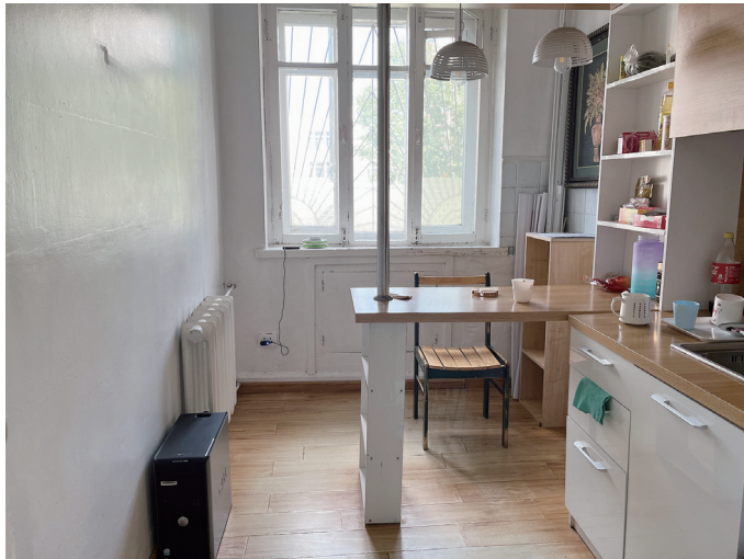
図 25 キッチン（左壁沿いに暖房設備、ストーブは右奥にあった）

キッチンに元々あったストーブは取り除かれ、都市規模の温水循環の暖房設備に変わっているが、部屋の間取りについては元のままだそうだ。社会主義時代に建てられた集合住宅にある標準的な間取りの一つということである。一室空間化とは対極の、個別に分節することが前提の生活空間となっている。