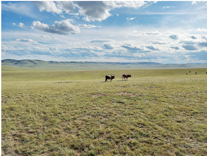
図2 ウランバートル東部草原

環状道路の外側の丘陵地の谷筋に沿ってゲル地区が広がっている。これらのゲル地区は北方に向かって拡大を続けており、視察時に現地の方から聞いた話によると、都市部の住民が夏期を過ごすための別荘エリア、郊外の村や集落のある地域にまで届きつつあるということである。