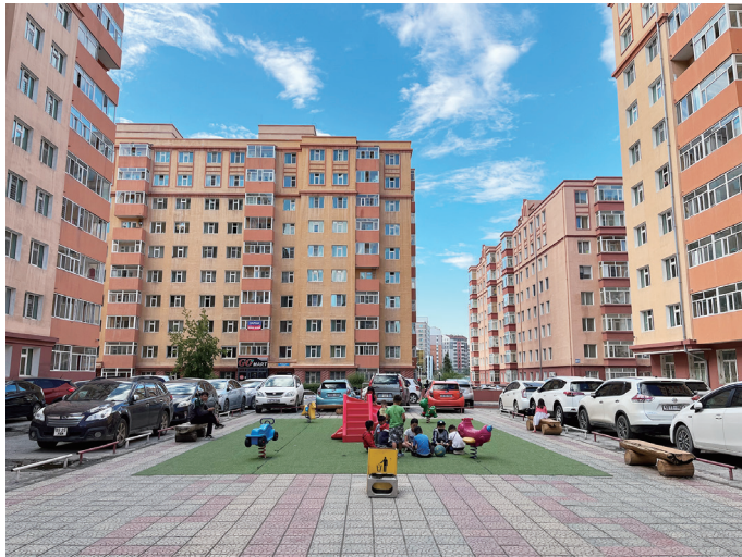
図 28 スフパートル区の集合住宅