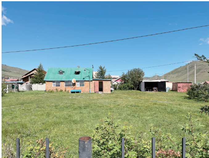
図 16 二階のあるバイシン住居の芝生に覆われた敷地（バイシン（左）、木造平屋の建物（右））

東南に面に街路をもつ角地で、フェンス沿いには綺麗に整えられた木々が並び、芝生で覆われた敷地内も綺麗に整備されている。敷地中央に脚のついた給水タンクや犬小屋があり、その東側が家主の敷地だそうだが、柵などで区画されてはいない。敷地の北寄りに、レンガ造のバイシンが建っている。南側の街路の中央付近に青く塗られた入口扉があり、そこからバイシンの玄関までまっすぐ自然石を敷き並べた通路がある。玄関からはもう一本、南東の角にあるトイレに向かって舗石ブロックの通路がある。東側の街路には車の出入り用だと思われる幅の広い扉があり、そこから入ると、すぐ右手（北東角）に元ガレージだったと思われる木造平屋の建物がある。内部は広く、草刈り機などの庭仕事の道具と、冷蔵庫やベッドなどの生活用具が混在していて、コンクリートのたたきにはカーペットが敷かれていた。訪問時には親戚だという小学生二人の生活空間となっていた。