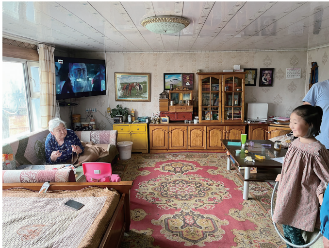
図 10 広い居間的な領域「トゥオム・オロ（大きな部屋）」

バイシンの建物内外も非常に綺麗に整備されており、全体に生活環境の整備に対する意識が高いことがうかがわれる。週に2、3度、家族で建物や庭の整備をしているという。家や調度品のペンキ塗りなどのほか、最近では新しい植林などを始めたりしているようだ。