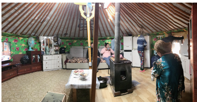
図6 ゲル住居内部（右が入口）

ゲル本体の南側に入口部分があり、そこに浅い切妻屋根のかかる木造の小さなヴォリュームが取り付けられていて、その西側面に入口がある。入ると玄関のスペースがあり、その右手に物置、左手にゲル本体への入口がある。ゲル本体の内部は、典型的ともいえる設えである。中央に天窓のある頂部を支える黄色く塗られた柱が2本あり、その足元にはストーブが置かれている。ストーブの煙突は、天窓の一部から外に伸びている。ストーブの横には調理用の作業台兼食卓があり、視察した私たちのために用意された軽食もここに置かれていた。この部分をとり囲むように、円形の外壁に沿って家財道具や家具が並んでいる。内部側から見るとゲル本体の入口の右手から順に、洗面台、木製の鮮やかに塗装された棚、冷蔵庫、ソファ、大きな液晶テレビを中央に構える低めのキャビネット、化粧台のある収納、ソファベッド、食器棚、調理器具と水のタンクと並ぶ。ゲル本体に入ると正面にあるのはテレビである。