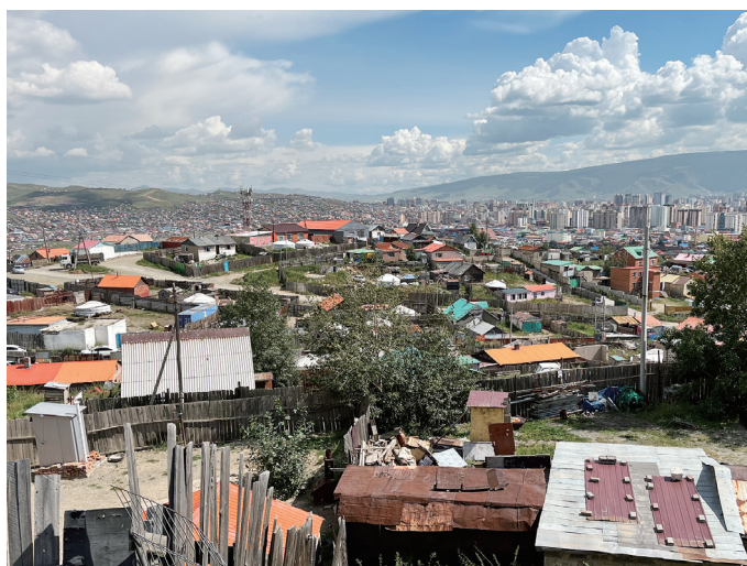
図1 ウランバートル北部ゲル地区

1924年、社会主義国家であるモンゴル人民共和国の成立後、都心中心部には本格的な都市計画がなされた。スフバートル広場を中心に街路が計画されており、広場を取り囲むように3階建ての街区型集合住宅（大きな中庭を持つコの字型建物）が整然と並ぶという計画である。その後、後述するハンオール区の集合住宅のような中層の建物も、社会主義時代につくられた。1960年ごろからは政策が工業重視に転換し、ウランバートルでは種々の工場が増え始めた 4 。労働力不足に対応するため労働者を地方から移住させたため、急速な人口増加に伴い住宅不足となり、集合住宅に住めない労働者の受け皿となったのがゲル地区の始まりである。その後、1992年の民主化に伴って整備された土地所有に関する法律などを背景に、ゲル地区への定住が明確化し、拡大していった。