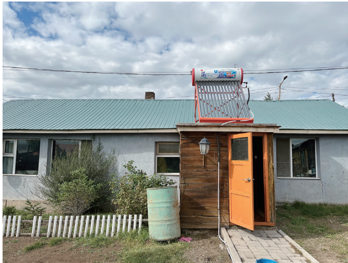
図9 バイシン正面（中央右寄り手前が玄関増築部分）

広い居間的な領域では、南側にダブルベッドとソファベッドが、北側にソファが並ぶ。ソファの前には低いテーブルがあり、食事の場にもなることが伺える。西側にあたる正面には木製のキャビネットが並び、絵が飾られている。南西の角には大きな液晶テレビがある。水回りの領域では、ペチカの煙突に繋がれた铸铁のストーブの隣に別のストーブがあり、上には鍋が積まれていた。ストーブも調理に使われているようだが、北側には電磁調理器のある近代的な厨房機器が置かれていて、冷蔵庫や電子レンジもある。東側、子どもたちの部屋との間仕切り壁の前には調理作業用の低いテーブルがある。広い居間的な領域と水回りの領域は、天井や壁の仕上材料も連続しており、一室空間化に向けられた指向の強さを感じられる。一方で、二つの領域が持つ雰囲気には明確な違いが感じられた。広い居間的な領域では、長い時間の流れを感じさせる落ち着いた印象の家財道具や家具が配置されていて、一方、水回りの領域には現代的な道具が並ぶ。こうした家具などとの関係から空間の分節が行われているのだが、一方で、先に紹介した「丘の上のゲル住居」のようにグラデュアルに活動的な場から静かな場が変わるのではなく、異なる質をもつ場を空間的に合体したかのようなものである。ペチカの煙突に繋がるストーブは暖房として使用されている。ペチカの煙突部分が暖かくなり暖房となるとのことである。この暖房効果を二つの領域で得ることも、一室空間化と関係があるだろう。家財道具や家具を手がかりに時間軸を内包する空間の分節が行われている点では、ゲル住居と共通している。