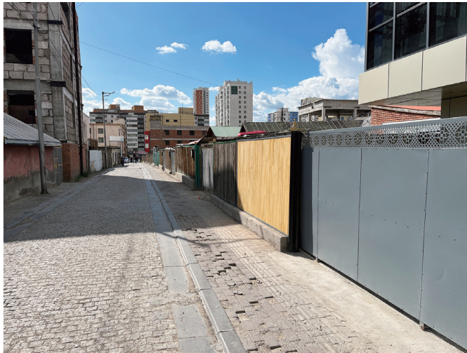
図13 ガンダン寺門前町の整備された部分の街路

ガンダン・テクチェンリン寺を取り囲むように、門前町が広がっている。この門前町は、その外周を大通りが囲っており、都市に内包されたかたちで歴史的地区として残っている。その内側を、東西方向の街路が地域を分節していて、街路沿いにゲル地区に類似した住まいが並ぶ。八尾教授によると、もともと僧侶達が住んでいたものが民間人の手に渡り、そのまま一般住居用の敷地として使用されているようだ。各住戸の区画の多くは高い木柵で囲まれており、街路を歩いていると両側に壁があるような印象を受ける。この地域の区画のなかには、ゲルがギリギリ建つ程度の幅しかない区画もある。近代以降に生まれたゲル地区と比べると、区画は大きくない。また、いくつかの区画を繋げ、中規模の現代的な建物を建てている場合もある。木柵に囲まれた歴史を重ねてきたゲルやパイシンの間に、近代的な建物が混在しているのである。