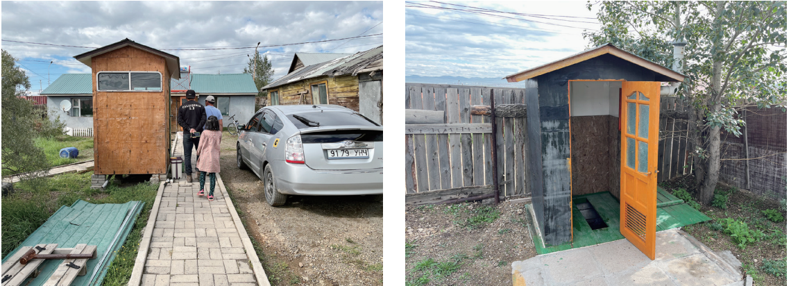
図8 シャワー小屋（左）とトイレ（右）

たシャワー室の小屋がある。トイレの小屋は1m四方ほどで、黒く塗られた外壁に明るい茶色の扉が取り付けられている。トイレ自体は、掘った穴の上に板を並べた簡素なものだが、不潔な感じは無い。シャワー室の小屋は1.5m×2.5mほどで、外部に置かれたタンクの水がポンプと温水器を介してシャワーに繋がられている。アルミ板で覆われた内部空間は、とても現代的な印象だった。庭全体が丁寧に整えられていて、草原のような中に、種々の木々がバランス良く配置され、外灯もある。その中を、舗石ブロックを市松模様に敷き詰めた通路が、駐車スペースまわり、パイシン、トイレやシャワーの小屋を繋ぐように横断している。