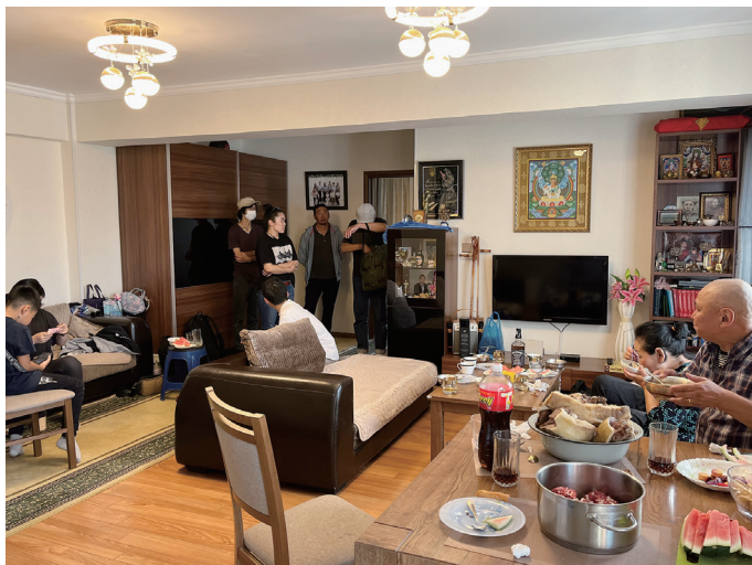
図 29 居間的な領域

建物中央のエレベーターホールから短い廊下を介し玄関に繋がる。エレベーターホールには数戸の住居の玄関が面している。玄関のドアを入ると、かなり広い居間的な領域があらわれる。この大きな空間の片側にはキッチンとバス・トイレ、反対側には寝室が 2 つ並んでいる。キッチンの前に外壁から突き出るように 4~6 人ほどで使える大きさのダイニングテーブルがあるが、部屋の幅の 4 分の 1 にも満たない。そのくらい大きな部屋である。ダイニングテーブルの横の窓際には、十分な空間をとって、低いテーブルを挟むようにソファセットが置かれている。北側の、開口部に対面する壁面にもソファがあり、存在感としては少々異質である。訪問時は夫婦二人の他に、遊びに来ていた親戚も含め 12 人がこの空間にいたが、各々が楽にくつろげるほどの広さであった。ダイニングテーブルに一組、ダイニングテーブル横のソファセットに一組、壁際のソファに一組と、各々がそれぞれに会話をしていたが、レストランにいるときのように、それぞれがそれぞれの領域をつくっていた。