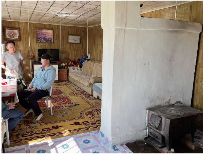
図 18 ペチカの壁（右）の奥にある広い居間的な領域

南側に設けられた扉から玄関である平屋部分に入ると、内部は壁と天井を白く塗られた空間で、東側に窓がある。ベッドのほか冷蔵庫、炊飯器、電子レンジなどの調理器具が置かれている。この平屋の玄関部分と西側にある二層の切妻の一階部分の間は扉で区画できるようだが、開け放して一体化して使っているようである。西側に入ると、キッチンの領域と広い居間的な領域が、ペチカの壁を挟んで一体的にある。八尾の論考における「玄関—キッチン—大きな部屋」という基本型のダイアグラム配列そのままの構成である。キッチンの領域では東側壁沿いに調理道具や作業場、西側（広い居間的な領域側）にペチカに繋がるストーブがあり、南側にオープンをついた調理台と作業台がある。玄関部分に炊飯器などがあったことから、一体的に使っていることがうかがわれる。広い居間的な領域に入ると、南側にダイニングテーブルとベッド、北側に大きなソファとソファベッド、西側の妻面にはキャビネットに液晶テレビが載せられ、3枚の絵が掛かっている。