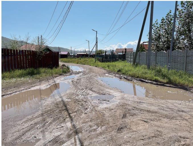
図 15 チンゲルテイ区ゲル地区の街路

ウランバートル中心部から北部に車を走らせると直ぐに風景が変化してくる。前述のようにウランバートルは東西に長く、南北を丘陵地帯に挟まれた谷筋にあり、北に向かうとすぐに丘にぶつかる。中心部から北部に向かう幹線道路の西側には丘陵地帯があり、谷筋に沿ってゲル地区が広がる。尾根に合わせて広がりを変えながら、バヤンゴル西部のゲル地区まで続く。幹線道路の東側はセルベ川沿いの低地で、道路よりも低い。中心部から5 kmあたりまでは民主化前に整備されたゲル地区が続くが、さらに北に行くとほとんどが21世紀に入ってからできたゲル地区である。川も蛇行しており、一年に幾度か起こる洪水による被害も多いようだ。新しく建設中のゲルやバイシンなどところどころに見られる。